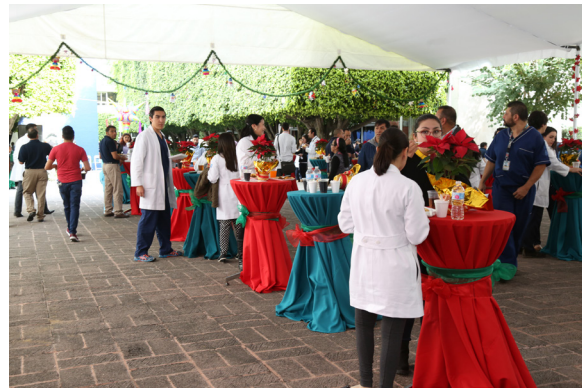
Convivencia de fin de año 2017 en la explanada del Quijote del INCMNSZ