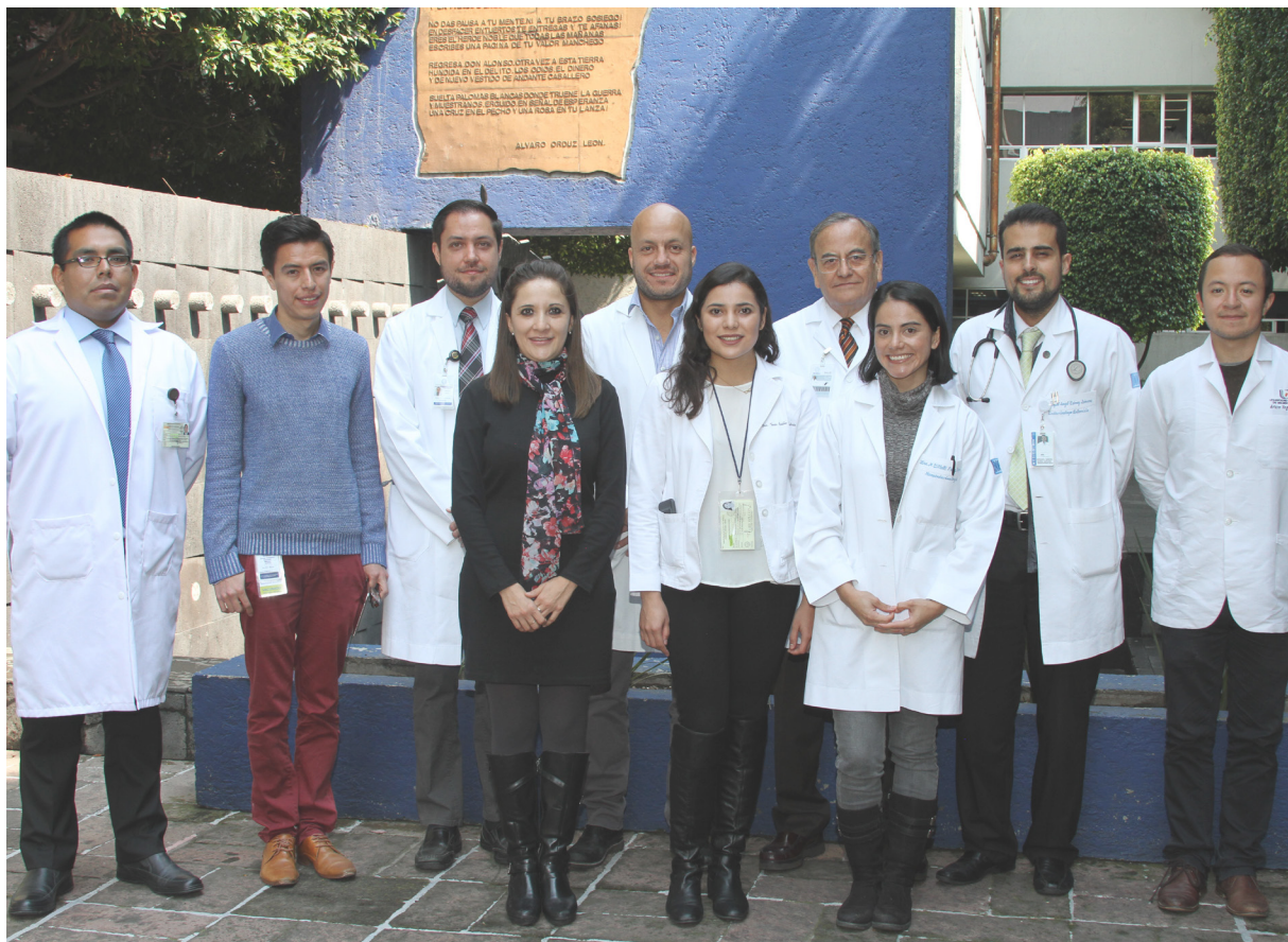
Equipo de trabajo de la Clínica de Neuroendocrinología

Para concluir, señaló que el reto que enfrenta la clínica para los años venideros es seguir diversificando los servicios médicos que ofrece, ampliando las actividades de investigación y enseñanza, y responder a la demanda de un problema de salud pública.