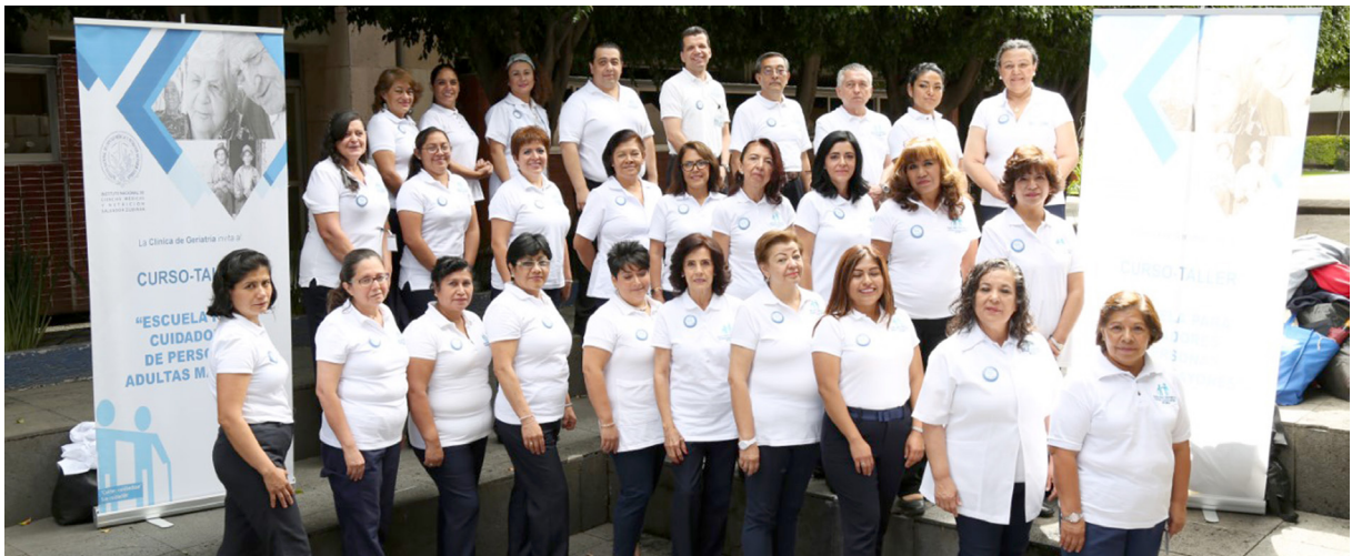
Egresados del Curso Taller "Escuela para Cuidadores de Personas Adultas Mayores"