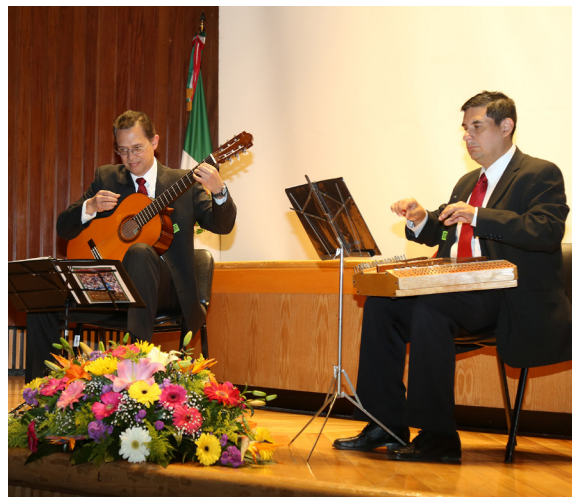
Grupo Guitarra y Salterio "Cuerdas Mexicanas"