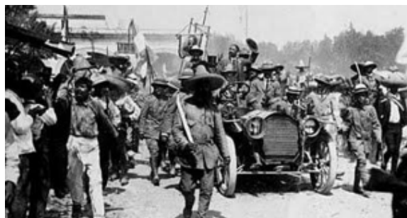
Fotografía de la Revolución Mexicana