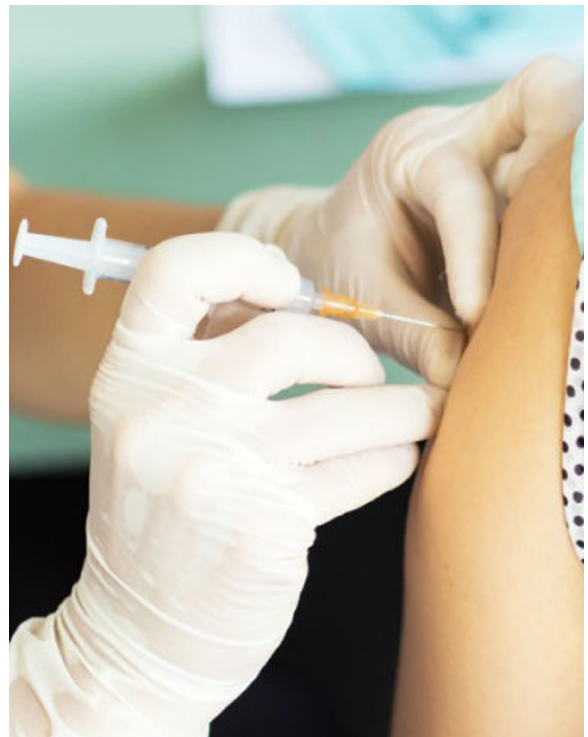
Aplicación de la vacuna

La Secretaría de Salud concluyó que las esporas se convierten en bacterias activas que se diseminan en el cuerpo y producen un tóxico llamado toxina tetánica (también conocido como tetanospasmina). Este tóxico bloquea las señales nerviosas de la médula espinal a los músculos, causando espasmos musculares intensos. Los espasmos pueden ser tan fuertes que desgarran los músculos o causan fracturas de la columna.