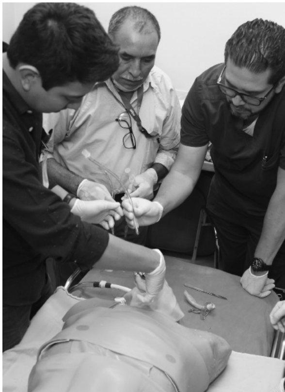
Curso Avanzado de Apoyo Vital en Trauma (ATLS)