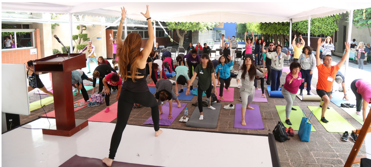
Práctica de Yoga en la explanada del Quijote del INCMNSZ

Destacó que una forma de vivir con bienestar, es que debemos asumir la responsabilidad de nuestra salud, que en gran medida depende de nosotros mismos, revisar hábitos de alimentación, hacer ejercicio todos los días, ya que el movimiento ayuda a prevenir, e incluso en ciertos casos a revertir padecimientos, y desde luego recomiendo integrar la meditación a la rutina diaria.