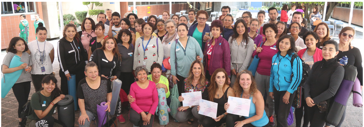
Participantes en el Primer Taller del Programa de Bienestar, realizado en el INCMNSZ

Afirmó que este programa ha beneficiado a la comunidad institucional, a través de la promoción y dando a conocer opciones para aumentar el bienestar en sus diferentes dimensiones como son la física, emocional, intelectual, laboral, social y ambiental.