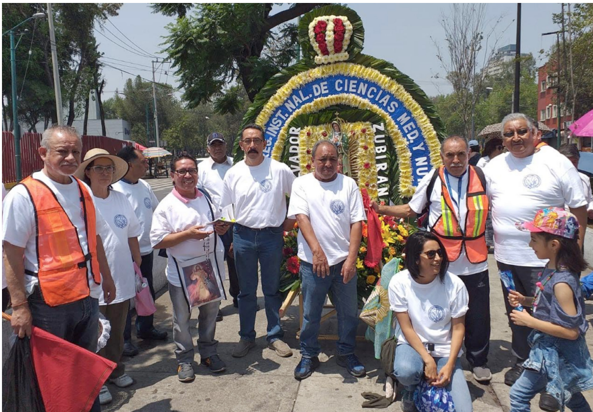
Personal del INCMNSZ, reunidos para la Peregrinación Anual a la Basílica de Guadalupe

A todos aquellos que asistieron a este evento, que ya es una tradición, les expresamos nuestro agradecimiento y los invitamos a seguir participando en la próxima peregrinación. De igual forma, hacemos extensiva la invitación a todo el personal para que el próximo año seamos más los asistentes al mismo.