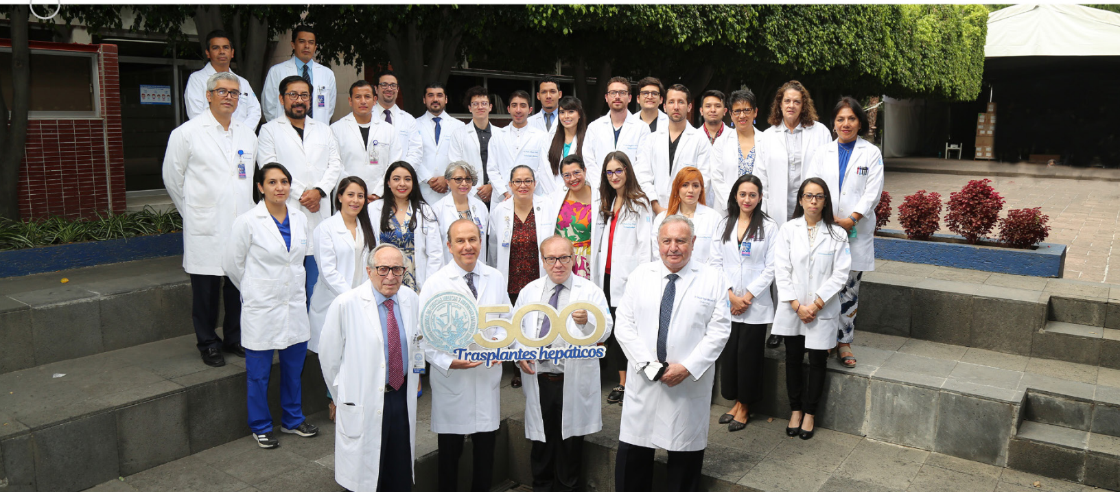
Equipo multidisciplinario de trasplante hepático

"Gratitud, Humanismo y Ciencia", Mural de Reconocimiento por Pandemia COVID-19