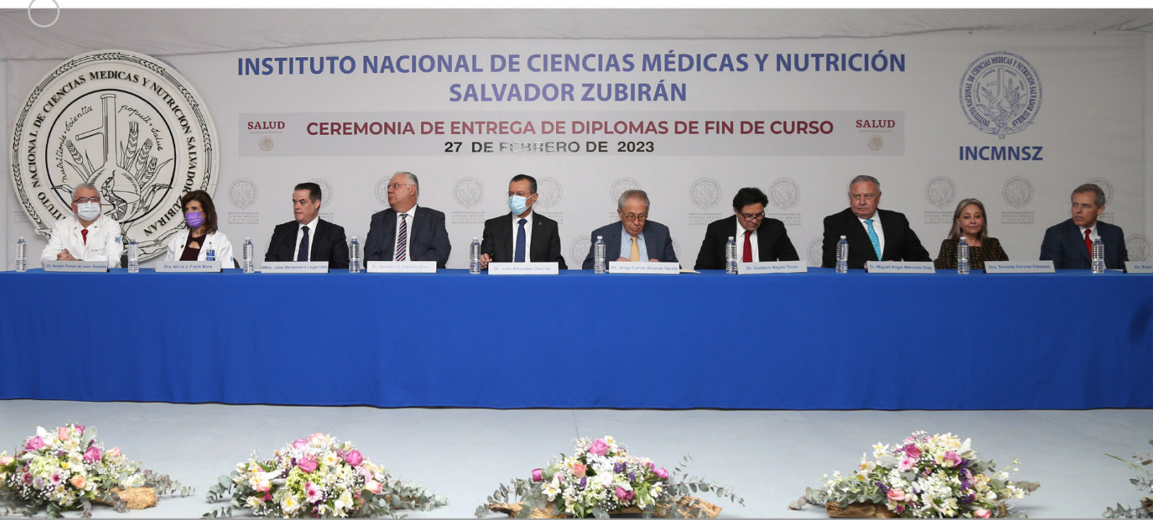
Podio de Honor de la Ceremonia de Fin de Cursos de Especialidad y Alta Especialidad en el INCMNSZ 2023