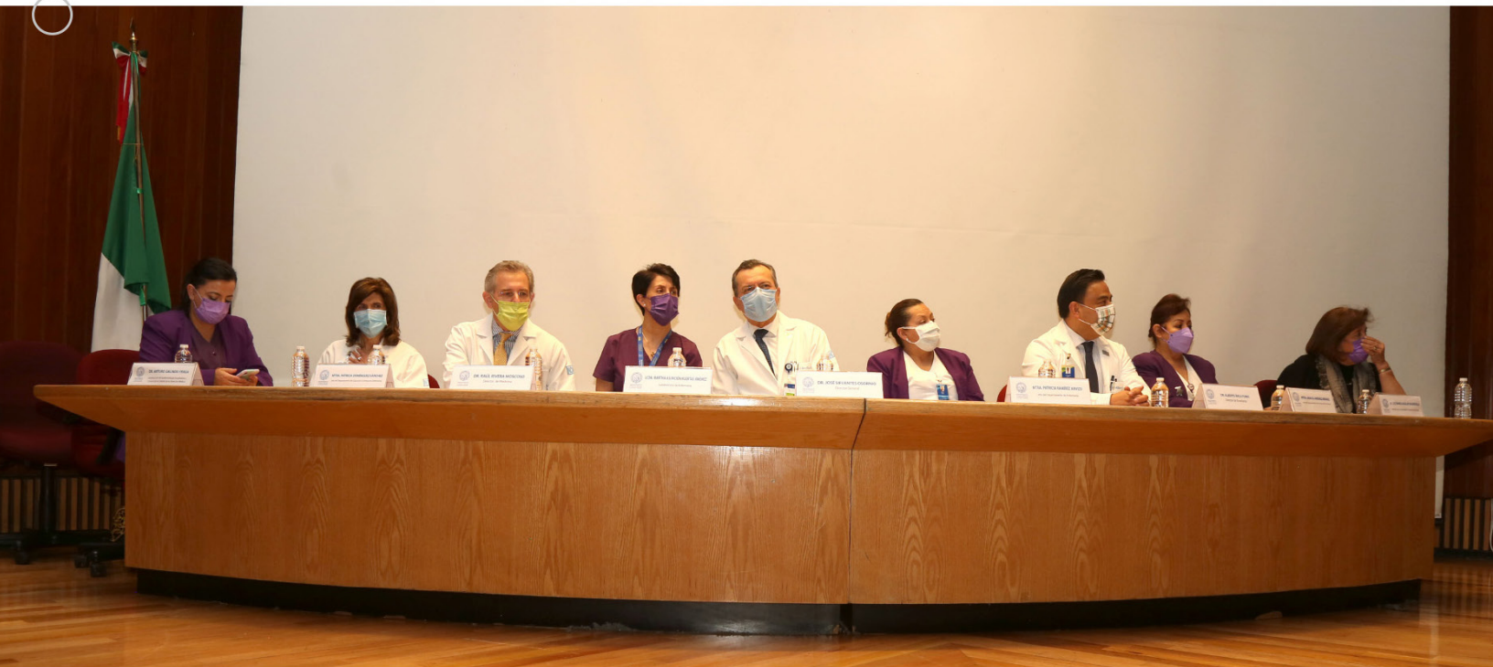
1er Foro Institucional del Día Internacional de Enfermería

Colaboración Comisión Nacional de Arbitraje Médico-INCMNSZ