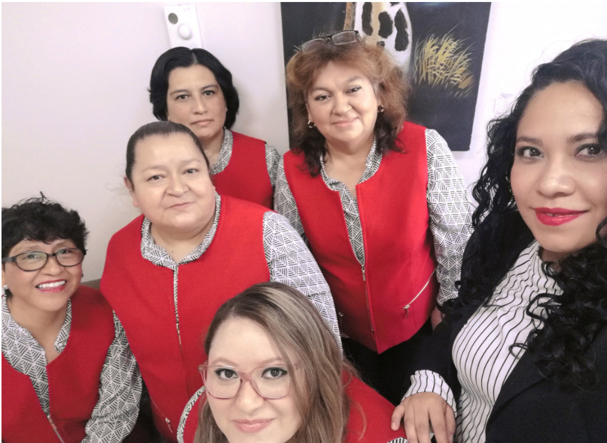
Personal de Recepción del cuarto piso, UPA

Les agradecemos y les pedimos que sigan trabajando de esa manera tan humana y empática con los pacientes y sus acompañantes.