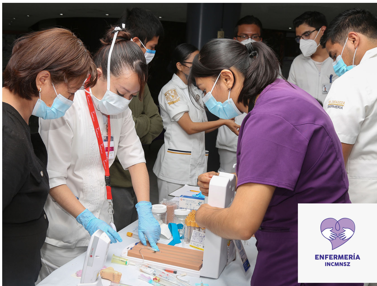
Asistentes al 1er Foro Institucional Conmemorativo del Día Internacional de Enfermería

Durante el evento se llevaron a cabo Talleres de Desarrollo de Competencias en Flebotomía, Manejo de Catéter Central y Manejo de Catéter Urinario, en el que el grupo de enfermería del INCMNSZ participó activamente. Lo anterior, también, como parte del Primer Foro Institucional Conmemorativo al Día Internacional de Enfermería.