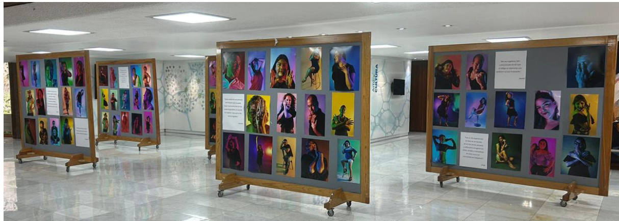
Exposición "Una Piel de Color" en el Día Mundial del Vitilígo en el Auditorio Principal del INCMNSZ