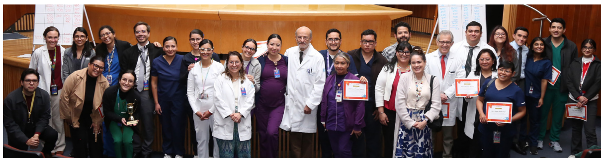
Asistentes Concurso “ Bichopardy ” y ganadores de la Copa WAAW