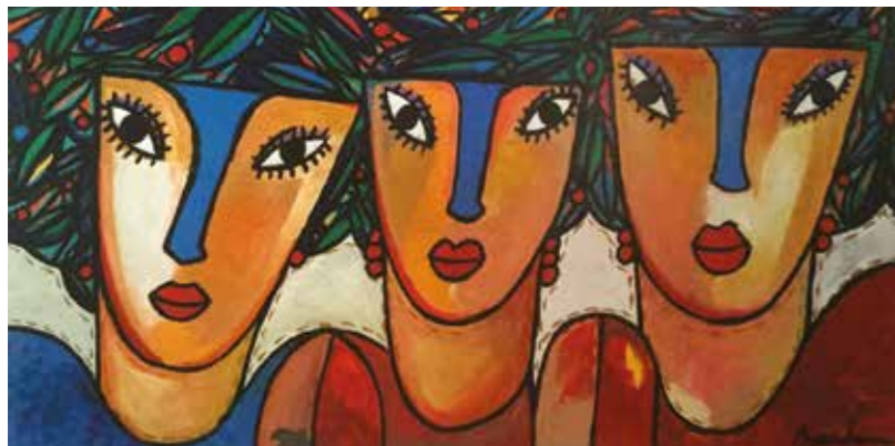
Título: Entre ellas

Ha expuesto en México, Estados Unidos, Canadá y varios países de Europa. Expone en el Bazar del sábado en San Ángel, y los domingos en el Jardín del Arte de Sullivan, en la Ciudad de México.