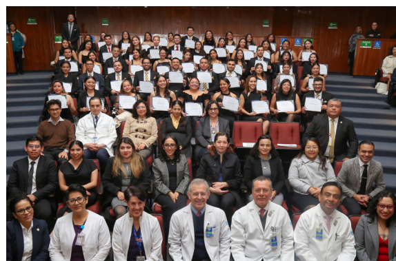
Graduados de las Especialidades de Enfermería UNAM- INCMNSZ

Finalmente, al declarar formalmente clausurada la ceremonia, el Director General reafirmó la misión del INCMNSZ de formar profesionales de la salud con excelencia técnica y una sólida visión humanista .