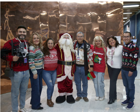
Integrantes del Comité Ejecutivo del SUTINCMNSZ