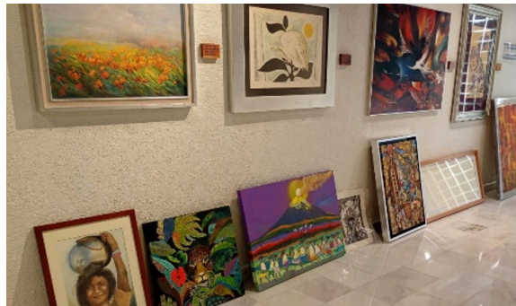
Diversas obras de diferentes artistas donadas al INCMNSZ