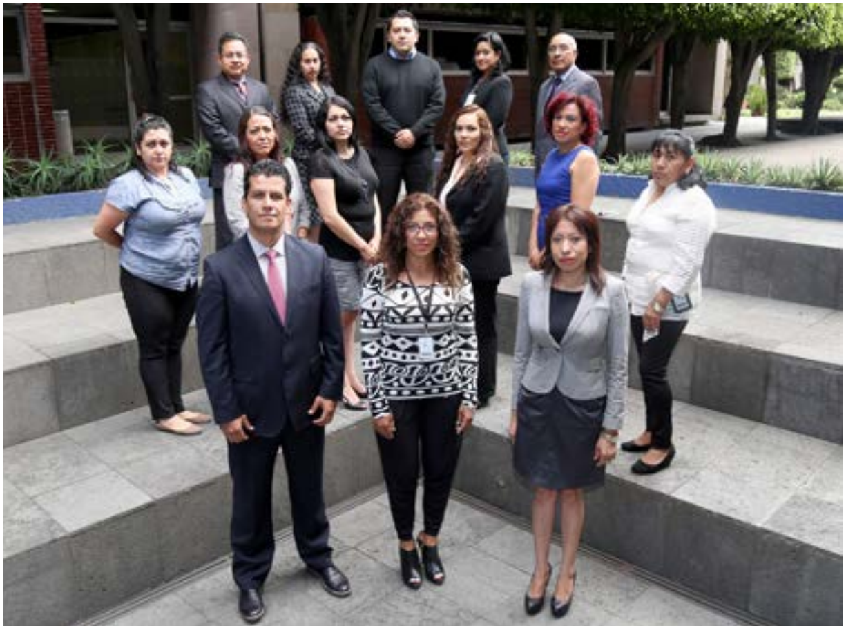
Personal del Órgano Interno de Control (OIC)

Para ello, cada una de las Dependencias y Entidades de la Administración Pública Federal tiene un Órgano Interno de Control que depende de la Secretaría de la Función Pública. El Instituto no es la excepción, y cuenta con un Órgano Interno de Control que ha ido evolucionando.