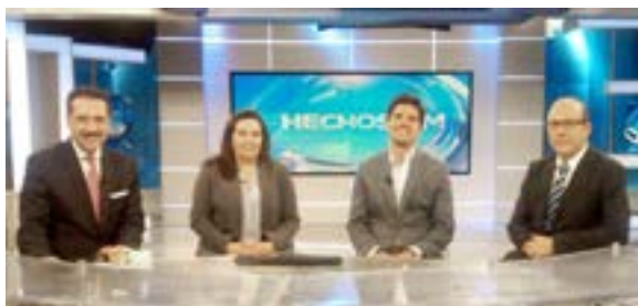
Entrevista con medios de comunicación

Para mí es un privilegio laborar en el INCMNSZ, por ser referente a nivel nacional e internacional en la investigación, docencia, y asistencia de alta calidad, y considero que se ha distinguido siempre por su visión de ir a la vanguardia. Además comparto plenamente el nivel de compromiso que lo distingue.