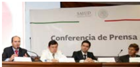
Conferencia de prensa de la Secretaría de Salud